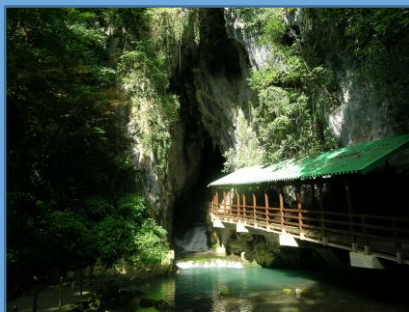
秋芳洞観光（イメージ）