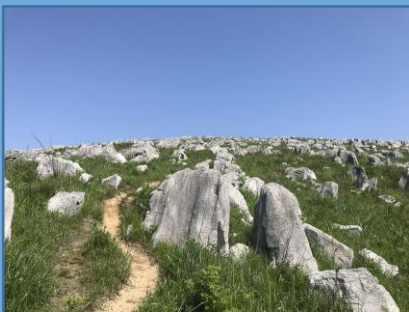
秋吉台観光（イメージ）