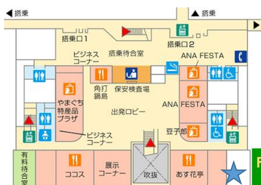
Floor Map フロアマップ